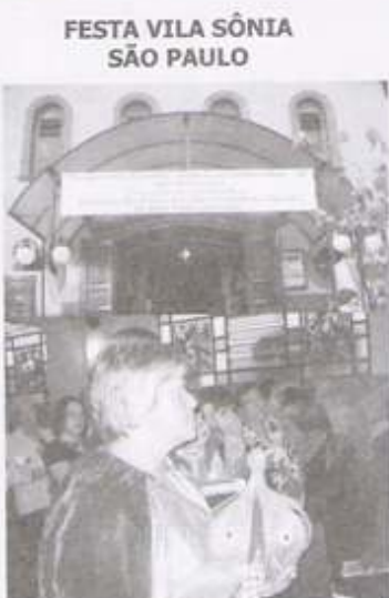
FESTA VILA SÔNIA SÃO PAULO