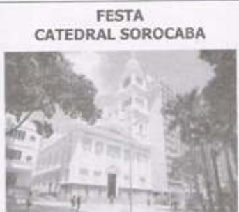
FESTA CATEDRAL SOROCABA