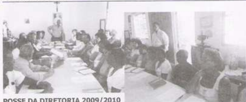
POSSE DA DIRETORIA 2009/2010