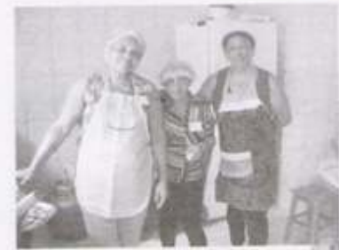
ENCONTRO COM CASAIS EM PILAR DO SUL (SP)