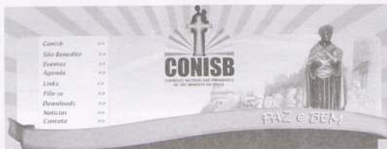
SITE NO AR WWW.CONISB.COM.BR