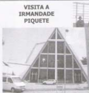
VISITA A IRMANDADE PIQUETE