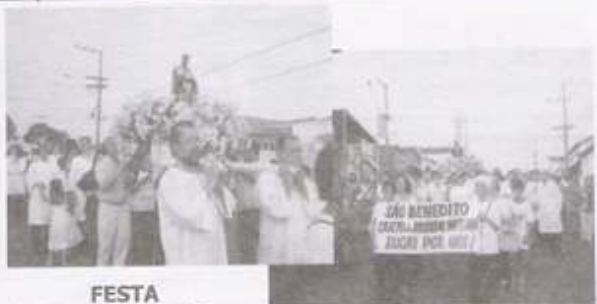
FESTA VILA CARVALHO SOROCABA