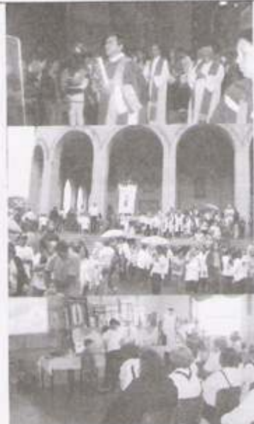
IV ROMARIA - APARECIDA