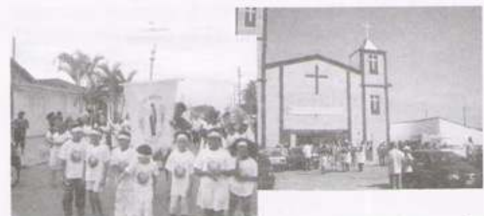
FESTA PRAIA GRANDE