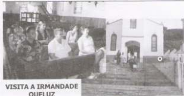
VISITA A IRMANDADE QUELUZ