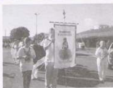
FESTA CERQUILHO PARÓQUIA SÃO BENEDITO