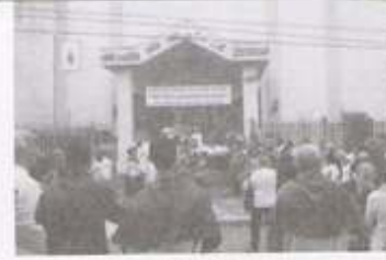
FESTA VILA FORMOSA - SÃO PAULO