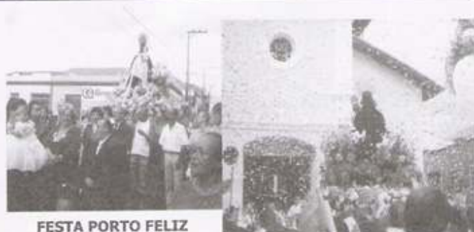
FESTA PORTO FELIZ