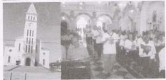
FESTA CERQUILHO - PARÓQUIA SÃO JOSÉ