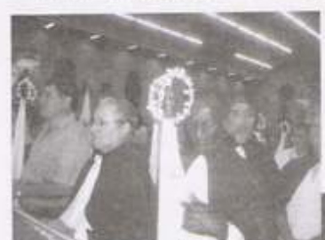
FESTA BIRITIBA MIRIM