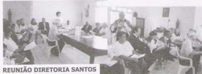
REUNIÃO DIRETORIA SANTOS