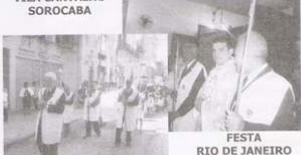
FESTA RIO DE JANEIRO