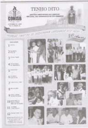
EDIÇÃO DO JORNAL COMEMORATIVO DOS 20 ANOS