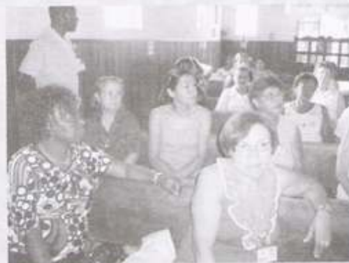
A Irmandade de São Benedito da cidade de Queluz acolheu os delegados do Conselho no último dia 14 de novembro.