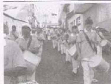
FESTA APARECIDA DO NORTE