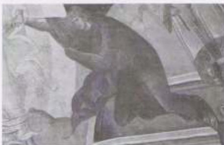
De modo significativo, a figura de Cristo não mostra nenhuma das feridas de sua paixão, mas ele é mostrado como a segunda pessoa encarnada da Trindade, em sua glória divina plena.