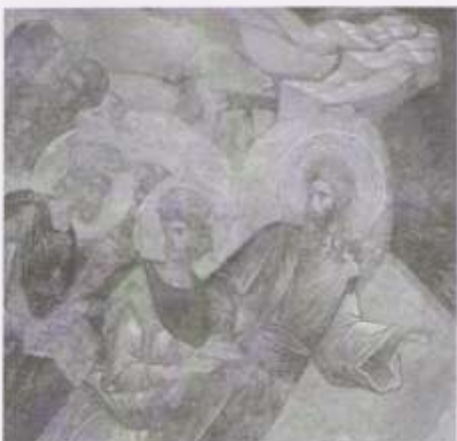
O sentido forte do movimento ascendente lá indicou que Adão e Eva não estão apenas sendo salvos da escravidão do pecado, mas estão sendo chamados, na verdade puxados, a algo maior.