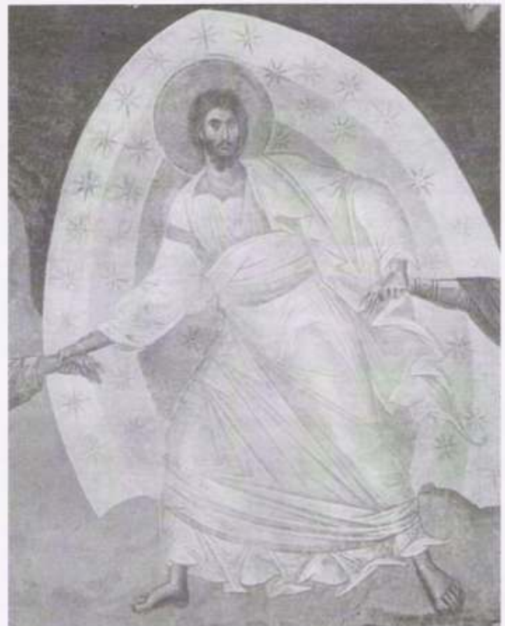
É uma imagem muito dinâmica. Os joelhos de Cristo estão dobrados, mas ele não está andando a nenhuma direção. Pelo contrário, o sentido do movimento é para cima. A ação é toda de Cristo.

No tipo ícone da Anastasis (Ressurreição) do século XIII, Cristo encontra-se na sua gloriosa mandorla, rodeada por estrelas, de pé sobre os portões quebrados do inferno e sobre os símbolos dispersos da escravidão do pecado, levando tanto Adão, quanto Eva pela mão e os apanhando para fora de seus túmulos. Com eles é salva toda a criação!