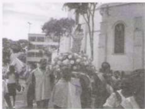
Tradicionalmente N. Sra. do Rosário se faz presente nos festejos ao Santo.