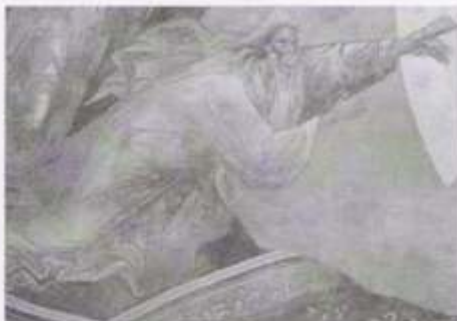
Adão e Eva estão sendo puxados de seus túmulos para Cristo e sua mandorla.