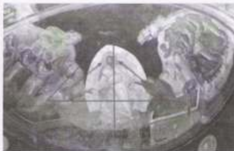
Tudo isto sugere que este ícone, não é sobre salvação, mas sobre "theosis" (divinização). Adão e Eva estão sendo puxados para a vida divina da Santíssima Trindade, divinizados pela ação de Cristo.