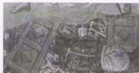
É significativo que a ênfase em Adão dada em ícones anteriores é dispensada aqui. Tanto Adão e Eva são puxados igualmente à mandorla de Cristo, sublinhando que esta divinização é o destino de toda a humanidade - em verdade, de toda a criação.