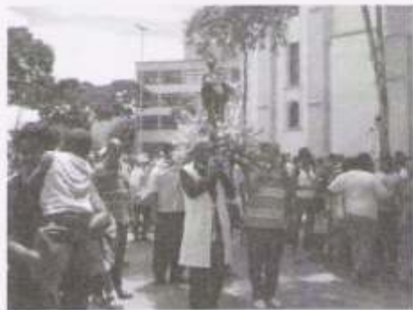
A comunidade da Casa Verde prestigiou a Festa de São Benedito

Desde o início do ano as Irmandades começam os preparativos e as festas em louvor a São Benedito acontecem. As cores, as músicas e a alegria de celebrar um Santo tão querido e tão popular! Pelo Brasil inteiro há festas. Aqui, no estado de São Paulo já no mês de janeiro quatro irmandades filiadas ao CONISB fazem suas grandiosas festas. São elas: a Irmandade da Casa Verde, de São Paulo, a Irmandade da cidade de Itu, a Irmandade de Porto Feliz e a Irmandade da Paróquia do Bom Jesus dos Aflitos em Sorocaba. Estivemos presentes em todas elas e pudemos partilhar momentos de muita devoção, evangelização, alegria e confraternização. Agradecemos aos festeiros, patrocinadores e às diretorias que se empenharam na realização dos eventos.