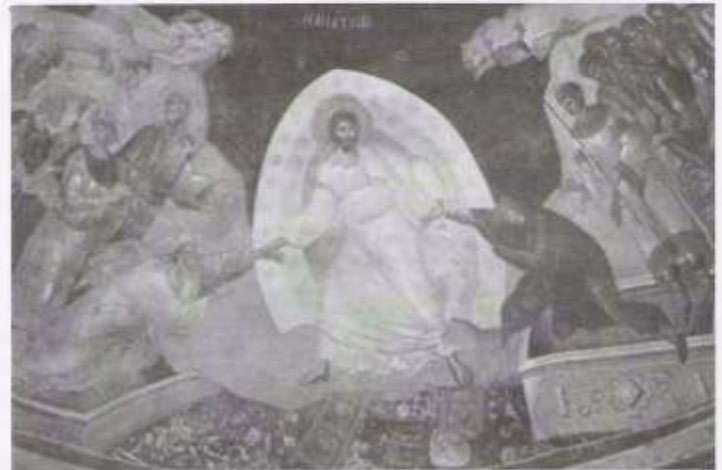
Afresco no Monastério Santo Salvador - Constantinopla (Istambul - Turquia)

impedem outras de desenvolverem seus dons. Na evangelização e na educação da fé é muito proveitoso o envolvimento das diversas áreas dos dons. A riqueza que nossos dons oferecem são para comunicar a beleza de Deus e do Evangelho de Jesus e conduzirem as pessoas ao bem maior que nos dá toda a verdade e nos encanta com sua beleza. A beleza do mundo de Deus está em sua diversidade encantadora. Louvado seja Deus pela beleza dos dons que colocou em nós.