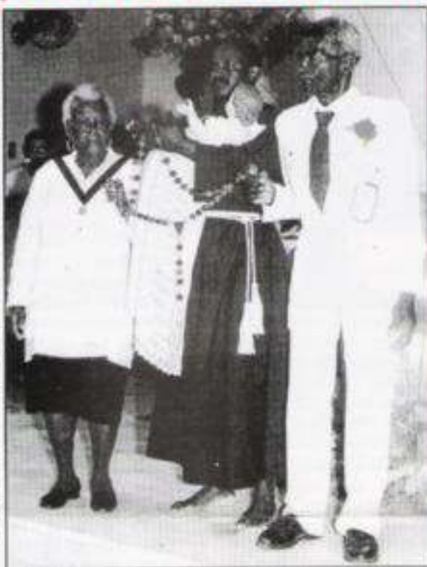
Na foto, feita durante a festa de São Benedito de Guaratinguetá, os senhores representaram os idosos durante Momento de Ação de Graças, reforçando a idéia da Campanha da Fraternidade 2003.

Não abram mão de seu espaço na família e na sociedade. Os jovens os agradecerão !